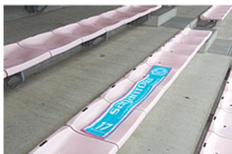
一枚のタオルマフラーで複数席を確保