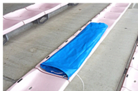
レジャーシート等を使用して複数席を確保