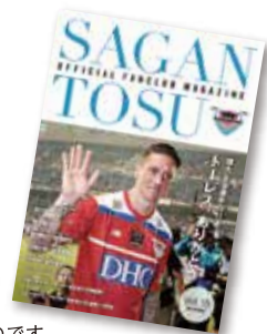
※掲載の誌面は2019シーズンのものです。