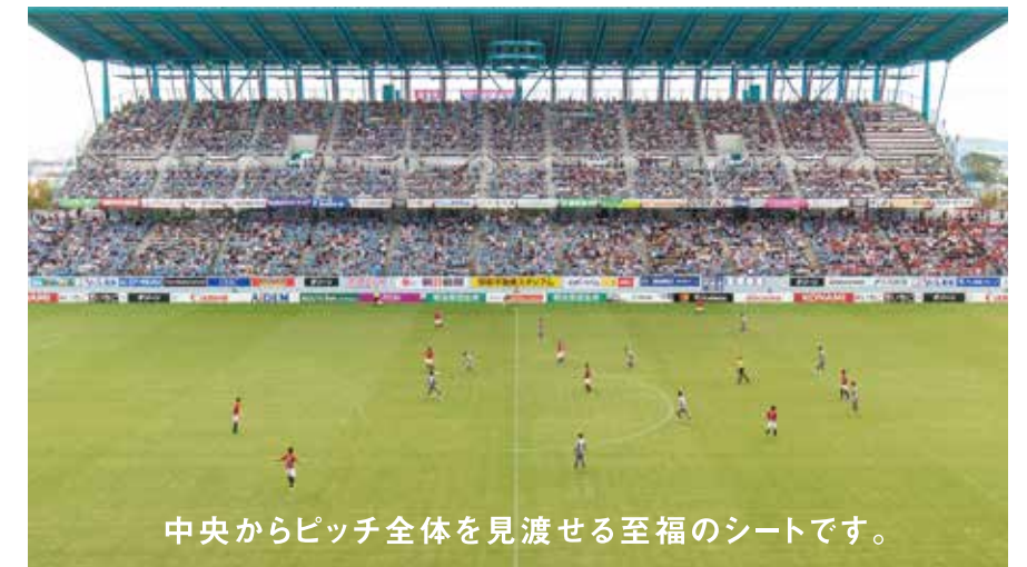
中央からピッチ全体を見渡せる至福のシートです。

申し込み受付期間 2019年 11/23(土・祝)~12/24(火) ※Webでのお申し込みは、11/30(土)からの受付となります。