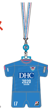
※掲載のデザインは変更になる場合があります。