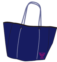
※掲載のデザインは変更になる場合があります。