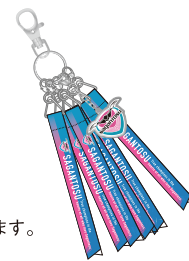
※掲載のデザインは変更になる場合があります。