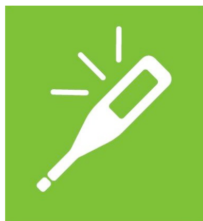
体調不良時の報告